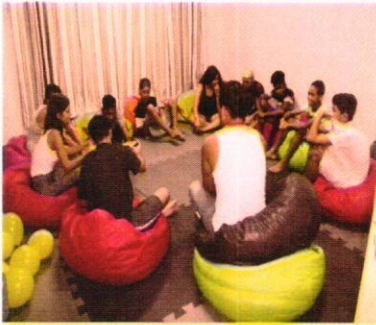
Bate papo sobre Covid 19 - fevereiro de 2020