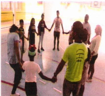
Carnaval EducArte – fevereiro de 2020