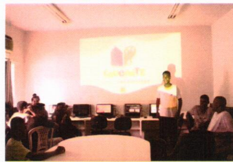
Palestra com os adolescentes - fevereiro de 2020