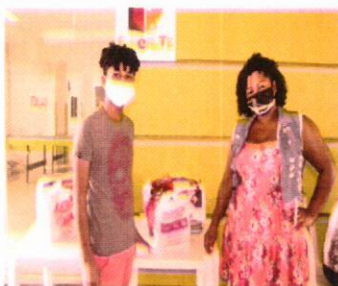
Entrega de Cesta básica