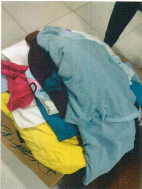
Direcionadas ao projeto das Ecobags