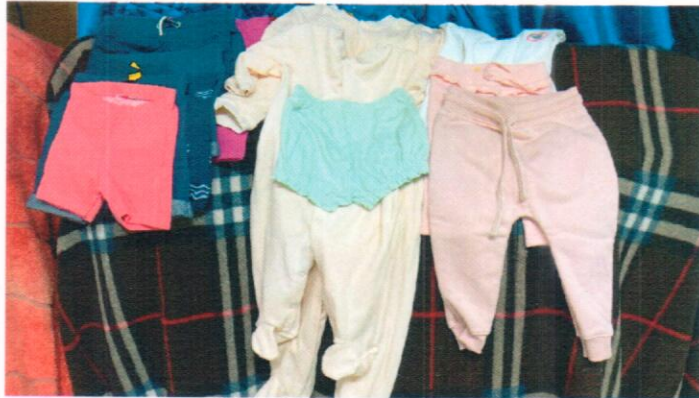
14 peças direcionadas para o Lar São Vicente de Paulo