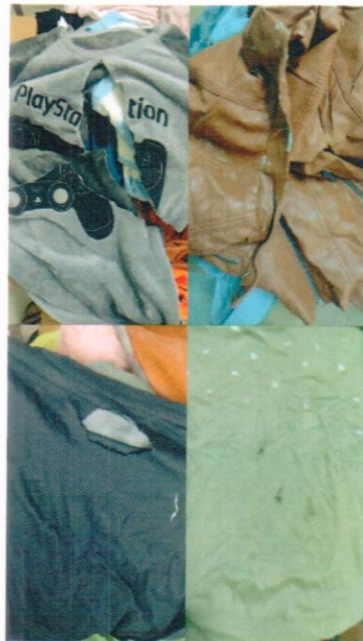
Roupas com defeito se possibilidade de uso